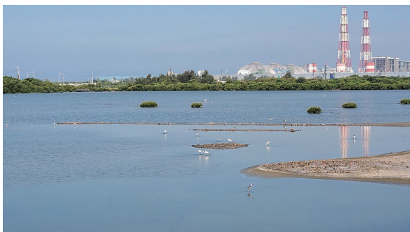
▲ 電力與環境可以共融發展，永安濕地就是明證、是起點，更是台電未來前進方向的典範。

JPG 檔 ( 圖片解析度長邊 3000 以上 )，圖像品質設定為 high/8 以上、圖像 dpi 設定為 72dpi 或以上。攝影類採系列照片，參賽作品數量需為 3 張 ( 含 ) 以上、8 張 ( 含 ) 以下，含完整中文圖片說明，每張照片說明文字以 250 字為上限。