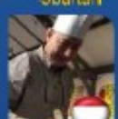
Rafael van der Vaart