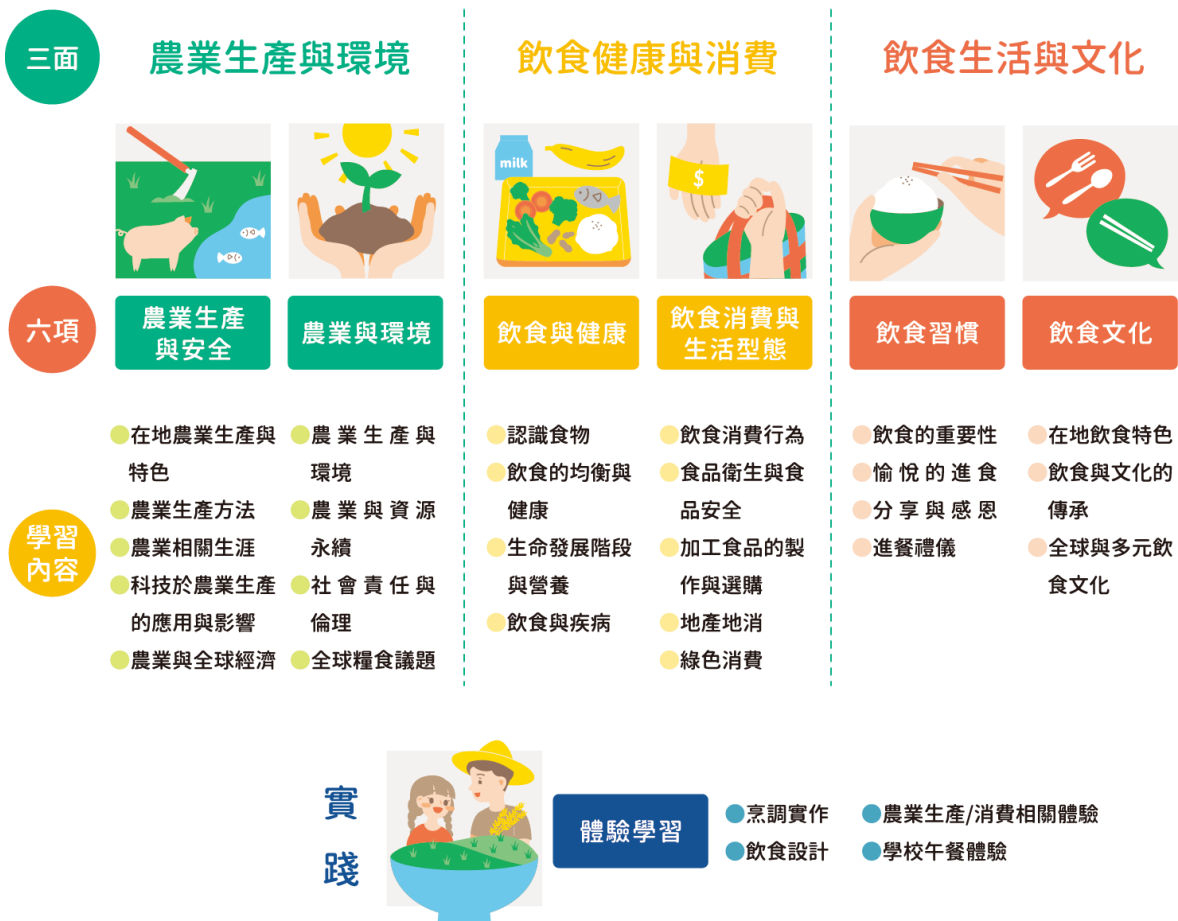
圖 1 食農教育 ABC 模式：食農教育三面六項