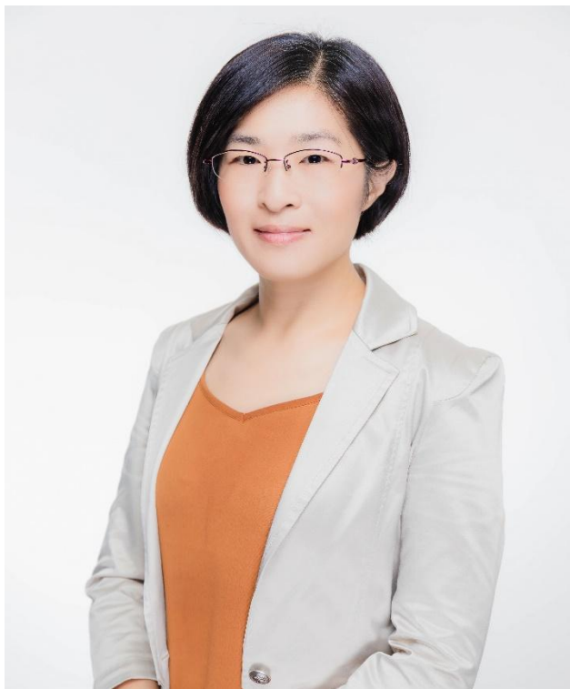
光電科學與工程學系教授