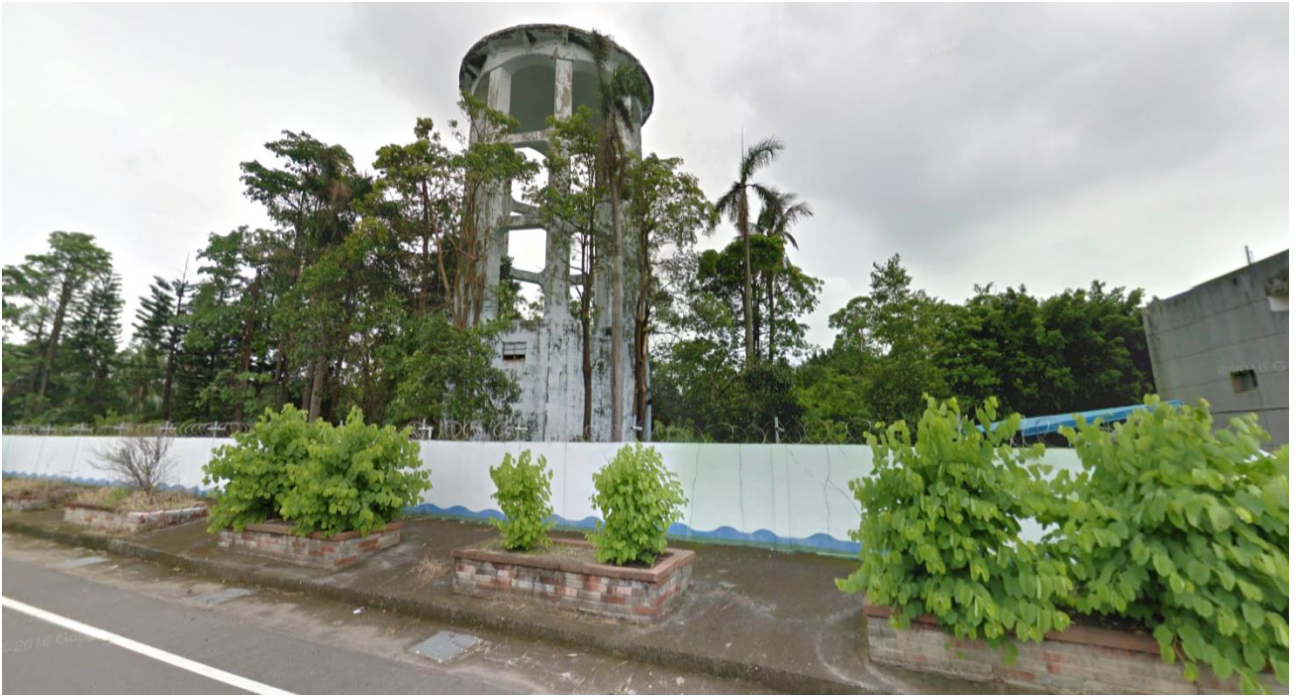
圖 3 新營員工訓練所高架水塔現況圖