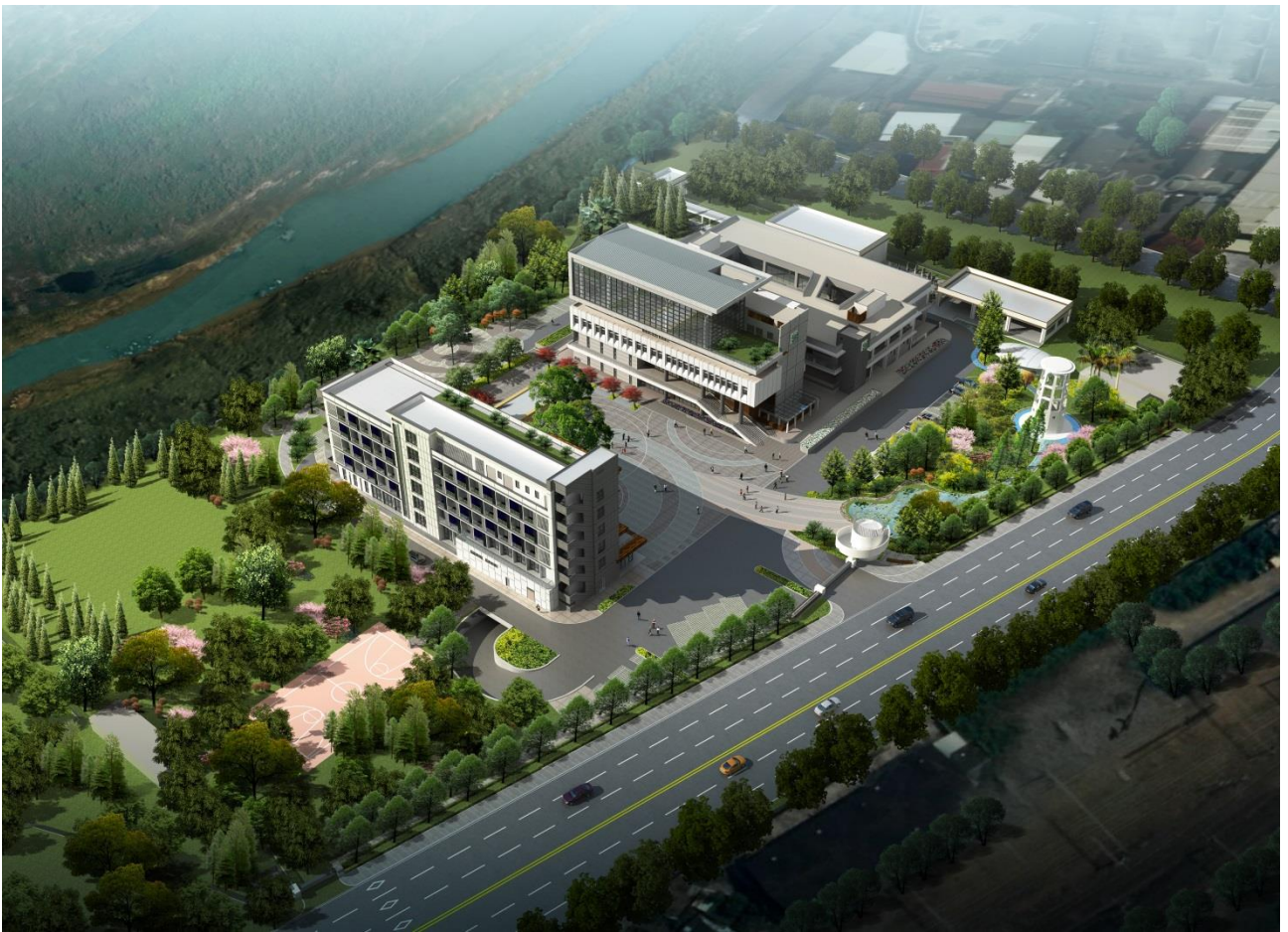
圖 4 新設自來水員工訓練園區鳥瞰圖