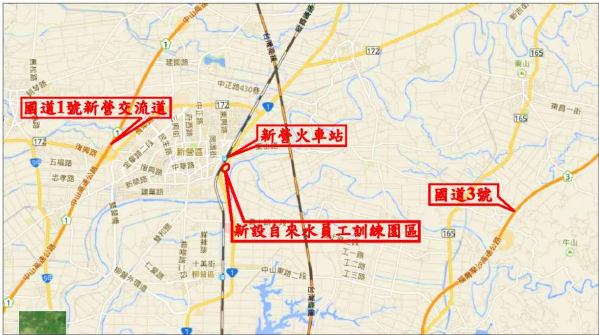
圖 1 新設自來水員工訓練園區地理位置圖